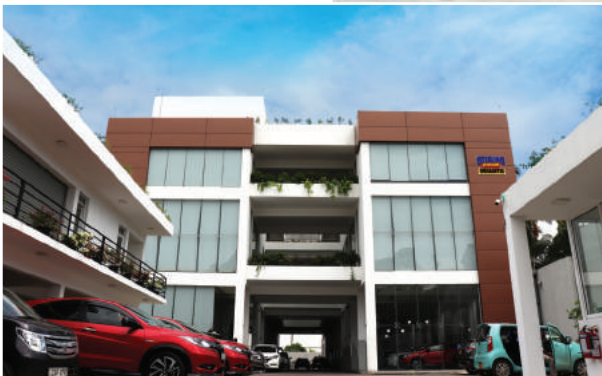
මෙහි ජපන් වාහනයේ පූර්ණ සේවාවන් සහ සියලුම කාර්මික අලුත්වැඩියාවන් උඩහමුල්ල අපගේ ප්‍රධාන ශාඛාවෙන් ලබා ගන්නට පුළුවන්. ඔයිල් වර්ග මාරු කිරීම සහ අමතර උපාංග සඳහාම විශේෂ වූ Sterling Aftercare

මධ්‍යස්ථානයක් නාරාහේන්පිට පිහිටුවා තිබෙනවා. මනාම ජපන් වාහනයකට අවශ්‍ය අමතර කොටස් ඉන් මිලදී ගන්නට පුළුවන්. අපගේ නාරාහේන්පිට ශාඛාව මගින් මිලදී ගත් වාහන අමතර කොටස් සවි කිරීම සහ ඔයිල් මාරුකිරීමත් සිදු කරනවා. ඒ මොහොතේ අප ලබා නොමැති වාහන අමතර කොටස් හෝ උපාංග යම්කිසි කාලසීමාවක් තුළදී ජපානයෙන් ආනයනය කර සේවා දායකයන්ට සපයා දෙනවා.